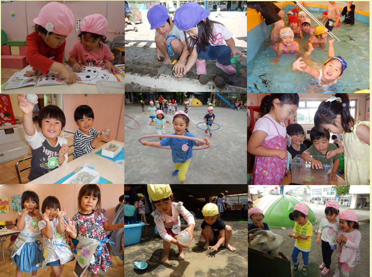
H31 年度 年少組の様子