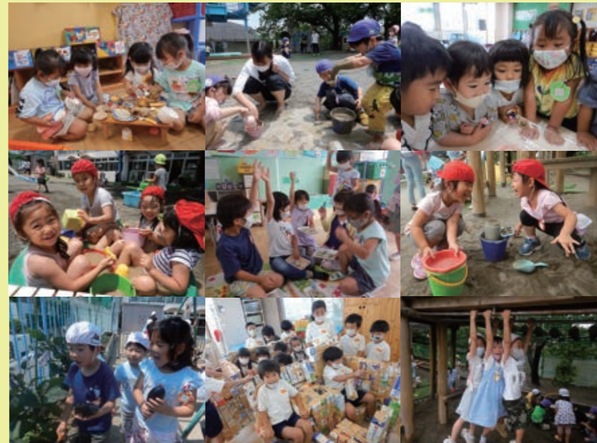
R3年度 子ども達の様子（上段 年少組 / 中段 年中組 / 下段 年長組）