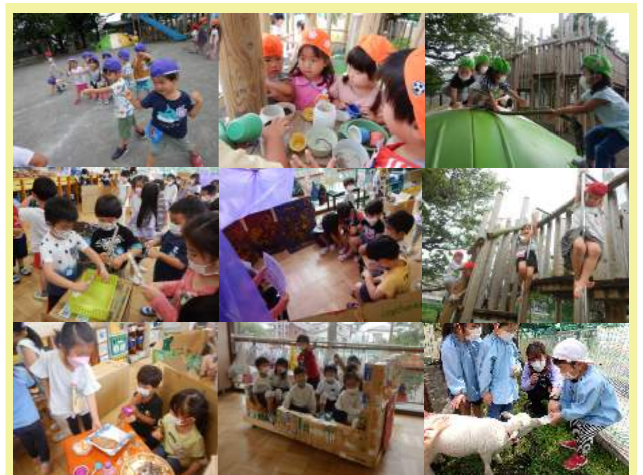
R4年度 子ども達の様子（上段 年少組 / 中段 年中組 / 下段 年長組）