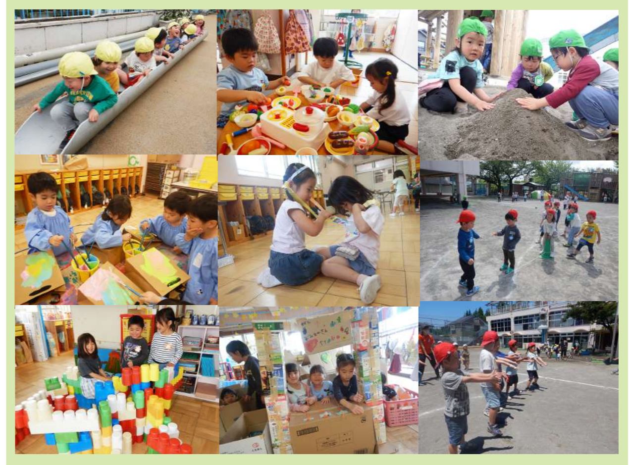
R7年度 子ども達の様子（上段 年少組 / 中段 年中組 / 下段 年長組）