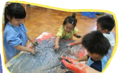
ハサミやのり、絵画以外にも、思う存分に気持ちを発散できるような活動も取り入れていきます。