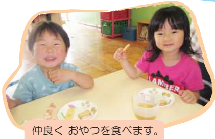
仲良く おやつを食べます。