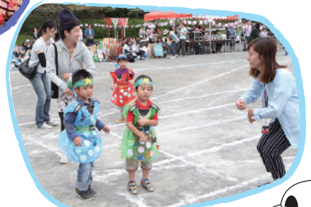
園行事の運動会にも参加します。