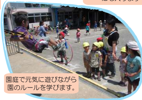
園庭で元気に遊びながら園のルールを学びます。