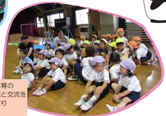
年少児と一緒に体育の活動に参加。園児と交流を持つ機会も多く取り入れています。