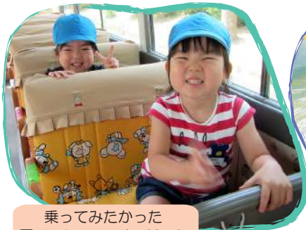
乗ってみたかった園バスによってわくわくドキドキバスドライブ！

子どもたちが『ようちえんはたのしいところだな』と感じられる様な活動を取り入れています。