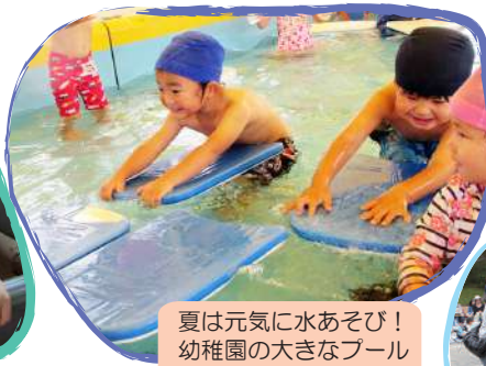
夏は元気に水あそび！幼稚園の大きなプールにも入ります