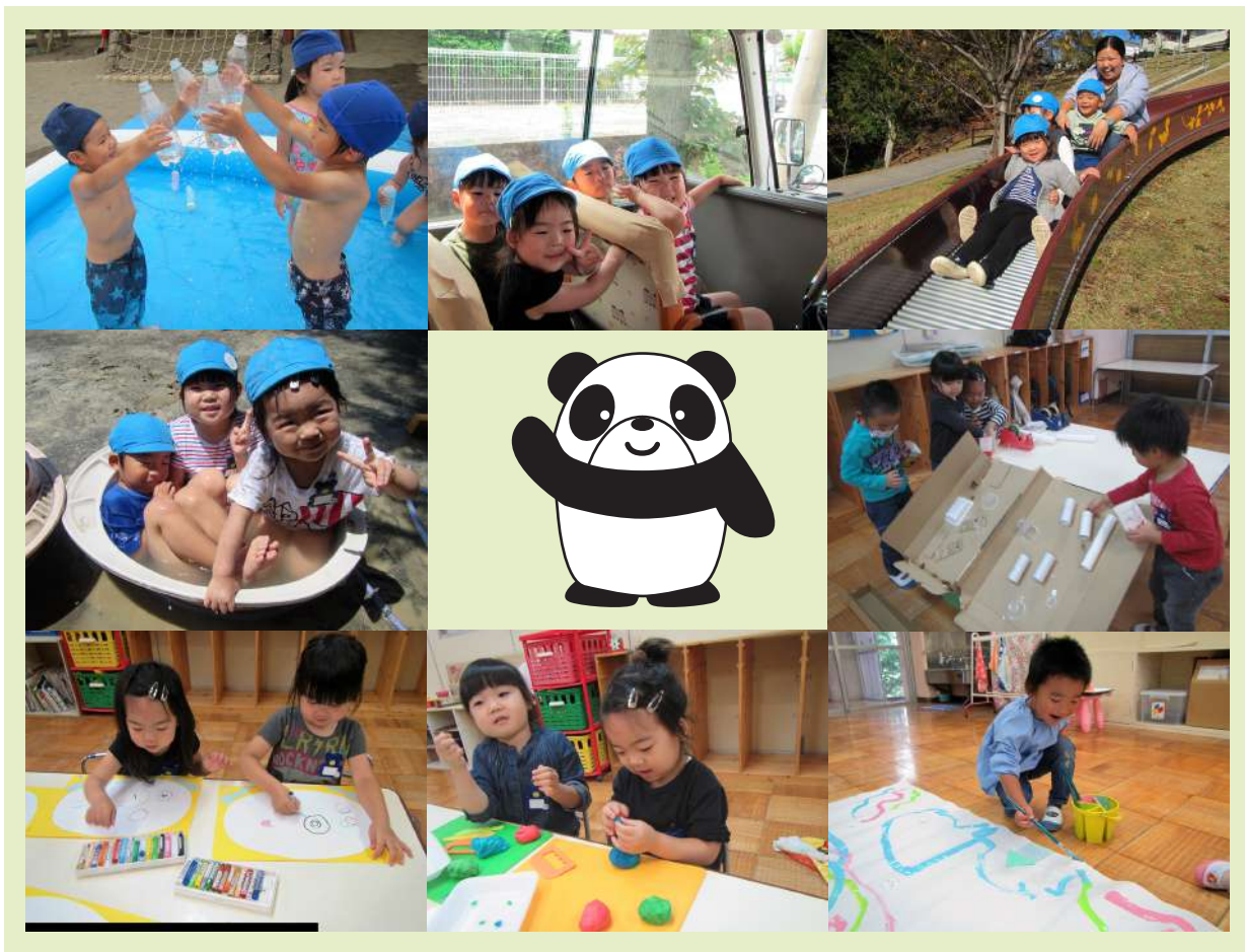
H29年度 パンダクラスの様子